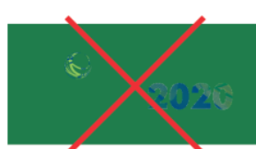
Aplicação em Fundas com Contraste Insuficiente