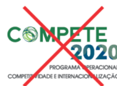
Alteração da assinatura ou acréscimo de outras