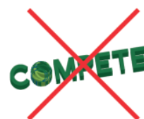
Tridimensionalidade e rotações do Logótipo