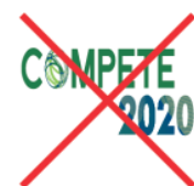
Distorção do Logótipo